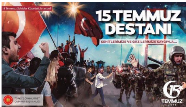
כרזה לציון יום השנה לניסיון ההפיכה הכושל שהוקדשה לחללים ולפצועים

קיליצ'דאראולו הצליח לסיים את המצעד ב-24 ימים, וקיים, כהבטחתו, עצרת המונית בכיכר "מאלטפה" הענקית בצד האסייתי של איסטנבול, בה נכחו, לפי הערכות, כמיליון איש. בעצרת הושמעו דרישות ל"זכויות", "שלטון חוק" ו"צדק". בנאום שנשא קיליצ'דאראולו, הוא הכריז על ה-9 ביולי, יום העצרת, כיום של תקווה ותחייה מחדש של העם הטורקי. בכך ביקש קיליצ'דאראולו להפחית מחשיבות ה-15 ביולי, עליו הכריז ארדואן כ"יום העצמאות של טורקיה החדשה", תזכורת לניסיון ההפיכה הכושל שהתרחש בשנה שעברה. תומכי ארדואן מתחו ביקורת חריפה על קיליצ'דאראולו בשל מועד קיום העצרת, והאשימו אותו בפילוג העם.