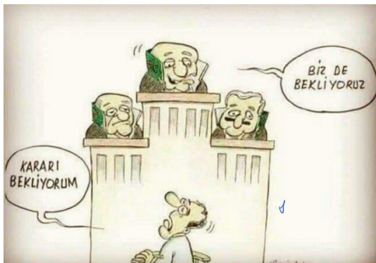
"הנאשם: אני מחכה לפסק דין, השופט: גם אנחנו", מתוך טוויטר

כבכל שנה, החלה הקהילה הגאה ותומכיה להתארגן לקראת העצרת השנתית, תוך שימוש ברשתות החברתיות ובראשן פייסבוק, בה הוקם העמוד הרשמי של המצעד. הקהילה קראה להמונים לקחת חלק בהתקהלות בכיכר טקסים הממוקם בסמוך לגזי פארק, תחת הסיסמה "תתרגלו, אנחנו כאן". בצד התמיכה לה זכתה הקהילה ברשתות, היו לא מעט גולשים שהתנגדו נחרצות לחידוש המצעד, וקראו לרשויות שלא לאפשר זאת. 9 בין המגיבים התוקפנים ביותר בלטו אנשי "בתי אלפארך", תנועה ימנית שמרנית לאומנית. בהודעה שהתפרסמה בתקשורת מטעם יושב-ראש התנועה, קורשט מיג'אן, הזהיר האחרון את הרשויות מפני הסרת האיסור לקיום המצעד. לדבריו, במידה ותיעשה טעות והרשויות תאפשרנה את קיום המצעד, הרי שהוא ואנשיו לא יאפשרו לקהילה הגאה לצעוד ברחבי איסטנבול. 10 חרף ההתרעות מצד בתי אלפארך, ניסו אנשי הקהילה הגאה לקיים את המצעד בבירה מבלי שקיבלו אישור מרשויות המדינה, וכתוצאה מכך נקלעו לעימות עם משטרת איסטנבול שהביא למעצרים של 22 מחברי הקהילה.