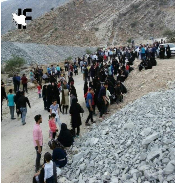
אזרחים איראנים העושים דרכם ברגל לקבר כורש, נלקח מתוך טוויטר

בתגובה לכך השיקו גולשים איראנים קמפיין רשת שנועד לעודד השתתפות אזרחים באירועים לציון היום, ולמחות על המגבלות שהטילו השלטונות. הגולשים הציגו את כורש כדמות מופת וכסמל לאומי שראוי להנצחה והצביעו על חשיבותו ההיסטורית. הם גינו את מאמצי המשטר למנוע את הטקסים לזכרו והעלו תמונות וסרטונים המתעדים את המחסומים שהוצבו בדרכים הראשיות המובילות לקבר, כשבחלקם ניתן לראות אזרחים העושים דרכם ברגל דרך ההרים על מנת להגיע למתחם. גולשים רבים הנגידו בין המגבלות שהטיל המשטר על קיום אירועי "יום כורש" למאמצים