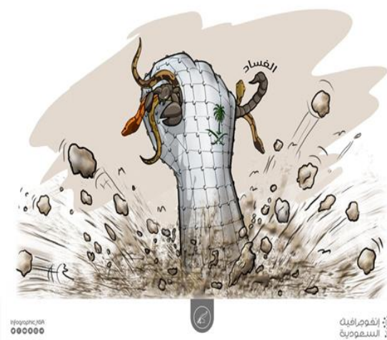
אגרוף המוחץ את מה שנתפס כשחיתות

המעצרים הופצו תיוגים נוספים, בחלקם הוצג יורש העצר בצורה מפורשת כמוביל המאבק: "אוהדי מוחמד בן סלמאן" (#محيو_محمد_بن_سلمان), "מוחמד בן סלמאן מזעזע את העולם" (#محمد_بن_سلمان_يبهر_العالم), "מהפכה 4 בנובמבר" (#ثوره_4_نوفمبر) ועוד.