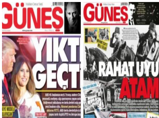
גיליונות העיתון "גונש". בגיליון הימני מה-10 בנובמבר מוקדש העמוד הראשון ליום האבל ל"אבי האומה", כהגדרתם, למול הגיליון השמאלי מנובמבר אשתקד ובו התייחסות מצומצמת ליום האבל על אתאטורק

גולשים חילוניים רבים הגיבו בציניות לדבריו של ארדואן, ולעגו לו כשטענו כי גם הוא "סוף סוף הפנים את הדרך הנכונה". לצד זה, היו לא מעט אחרים שמתחו ביקורת חריפה נגד הנשיא והאשימוהו ב"תקייה" (Takiye), שמשמעותה הצגת אג'נדה מזויפת למען הצלחתה של אג'נדה מוסווית (ומוכרת בעיקר בהקשר התנהגותו של השיעי בסביבה עוינת), העשויה להיחשף, לטענתם, לאחר הבחירות ב-2019. לראייתם, ארדואן משתמש באתאטורק כקלף בבחירות על מנת שלא לאבד קולות על רקע אידאולוגי מקרב המחנה הלאומני, והצהירו כי אינם מאמינים ל"פניית הפרסה של ארדואן בשדרות אתאטורק".