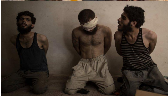
אנשי דאע"ש לאחר שהסגירו עצמם לכוחות הפשמרגה הכורדיים, מתוך רשת טוויטר

כיבוש הטריטוריות מידי דאע"ש, בדגש על חויג'ה ואל-רק'ה, הביא לכניעה המונית של פעילים מקרב הארגון. מעל לאלף לוחמי דאע"ש הסגירו עצמם לכוחות הפשמרגה הכורדים לאחר שנמלטו מהלחימה בחויג'ה. 3 זאת ככל הנראה על רקע פקודתו של המפקד המקומי מטעם הארגון שחשש שתפיסתם של הלוחמים על ידי הצבא העיראקי או המיליציות השיעיות אל-חשד אל-שעבי, שהתקדמו לעבר העיר, תביא להוצאתם המידית להורג. 4 בדומה לכך, כ-100 לוחמי דאע"ש נכנעו באל-רק'ה, בטרם השלימו הכוחות הסורים את כיבוש העיר. 5 למרות שמדובר בתהליך שנמשך מזה שנתיים, הרי שתופעת