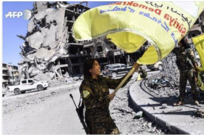
מפקדת במיליציה הכורדית YPG המנופפת בדגל ה-SDF ברחובות אל-רקה, מתוך רשת טוויטר

ציוצים אלה ואחרים הופצו תחת התגיות (האשטגים) "מאוחדים נגד הקיצוניות", ו"דאע"ש מובס", באנגלית ובערבית.