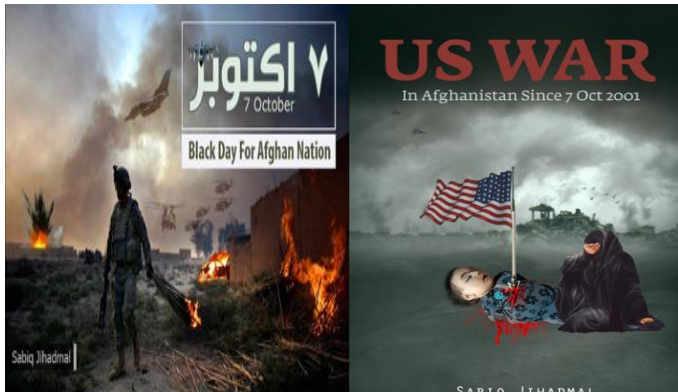
תמונות שהופצו בחשבונות הטוויטר והטלגרם של פעילי טאליבאן לרגל ציון יום השנה לפלישה האמריקאית לאפגניסטן

יום הפלישה השישה עשר של ארצות-הברית לאפגניסטן היווה הזדמנות עבור הטאליבאן להציג את הנזק שנגרם למדינה ולעם האפגני כתוצאה ממלחמה ארוכת שנים זו, ולהציג עצמה כיריבה עיקשת שמתכוונת להשתלט מחדש על אפגניסטן. בהודעה שפורסמה באתרי האינטרנט של התנועה נכתב כי "אנו נחושים לכפות [את יציאת] כל הכוחות הכובשים. זוהי זכותנו החוקית. עלינו להגן