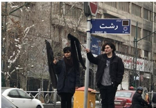
"הבנות של רחוב המהפכה", מתוך דף הטוויטר של

בשנים האחרונות הפכו הרשתות החברתיות לזירה מרכזית לניהול מאבקן של הנשים באיראן נגד האפליה הנהוגה כלפיהן בתחומים מגוונים. הסוגיה חזרה לסדר היום עם פרוץ מחאת הרעלה בינואר האחרון שהחלה באקט מתריס של צעירה איראנית שהסירה את הרעלה והניפה אותה לעיני כוחות הביטחון. המחאה, שהתרחבה למספר ערים מרכזיות באיראן, שבה וממחישה את הפוטנציאל הטמון ברשתות להעלאת המודעות הציבורית לזכויות הנשים והפיכתן לאמצעי להפעלת לחץ על שלטונות איראן להתאים את מדיניות המשטר לשינויים החברתיים והתרבותיים שעוברת החברה האיראנית.