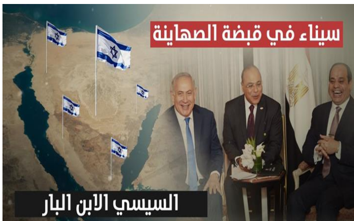
כרזה שהופצה בטוויטר, תחת הכיתוב "סיני

ב-3 בפברואר דיווח ה"ניו יורק טיימס" על שיתוף פעולה ישראלי-מצרי בלחימה נגד קני הטרור בחצי האי סיני, במסגרתו ביצעה ישראל במרחב זה בהסכמתה של מצרים למעלה ממאה תקיפות אוויריות. 14 הדיווח הצית שיח רשתי נרחב בקרב גולשים מצרים שהתאפיין בתגובות מעורבות. מחד גיסא, תומכי האחים המוסלמים ואנשי שמאל גינו את המעורבות הישראלית והאשימו את המשטר המצרי בבגידה. לראייתם, צבא מצרים איננו אלא כלי שרת בידי ישראל לקידום האינטרסים שלה באזור. מאידך גיסא, נשמעו קולות מצד תומכי הנשיא עבד אל-פתאח אל-סיסי ואנטי אסלאמיסטים שהביעו תמיכה בשיתוף הפעולה והדגישו כי מדובר במהלך מבורך התורם לביטחון הלאומי של מצרים.