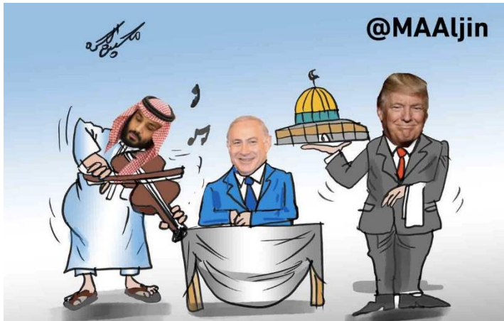
קריקטורה המציגה את תמיכת סעודיה בהחלטה להעביר את שגרירות ארה"ב לירושלים, מתוך טוויטר

לחיות! אנו עדים להבטחת בלפור חדשה". 9 בפורסט שהפיץ גולש מעזה נכתב: "שליטי ערב, זנחתם את העם כדי שהוא יגן לבדו על הקֶבֶל 10 הראשונה, הותרתם את הפלסטינים ללא נשק כדי שיתעמתו עם המוות למען מסגדנו אל-אקצא [...], אך מה שמייאש אותנו ומחסל את אמונתנו [...] הוא הדיכוי שלכם נגד [האתוס הפלסטיני] שירושלים היא בירת