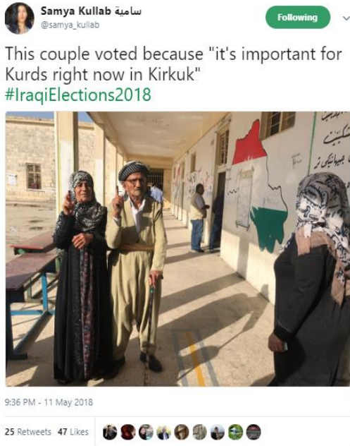
זוג קשישים כורדים לאחר ההצבעה בקלפי, מתוך טוויטר

חרף האיומים וההתקפות מצד דאע"ש, עיראקים רבים פרסמו ביום הבחירות את תמונותיהם כשהם מצביעים בקלפיות ומציגים בגאווה אצבע מוכתמת בדיו כהוכחה. בכרכוכ צולם זוג קשישים ממוצא כורדי שהצהיר כי הצביע "משום שזה חשוב כרגע לכורדים בכרכוכ", 33 וצעירה עיראקית שציינה את גאווהה "על מילוי חובתה כאזרחית עיראקית". 34 בציוץ נוסף, תיעד משתמש טוויטר עיראקי את סבו בן ה-89, "שבקושי מסוגל ללכת", כהגדרתו, כשהוא מצביע בקלפי, לצד התיוג #גאווה_עיראקית. 35 פוסטים דומים הופצו גם על ידי עיראקים המתגוררים כיום מחוץ למדינה. דוגמה לכך בתמונה שפרסם איסמעיל אל-סודאני, תת אלוף במילי בצבא העיראקי המתגורר כיום בארצות הברית, ובה הציג את אצבעו המוכתמת לצד הכיתוב למען "עיראק שלמה, חזקה ומשגשגת". 36