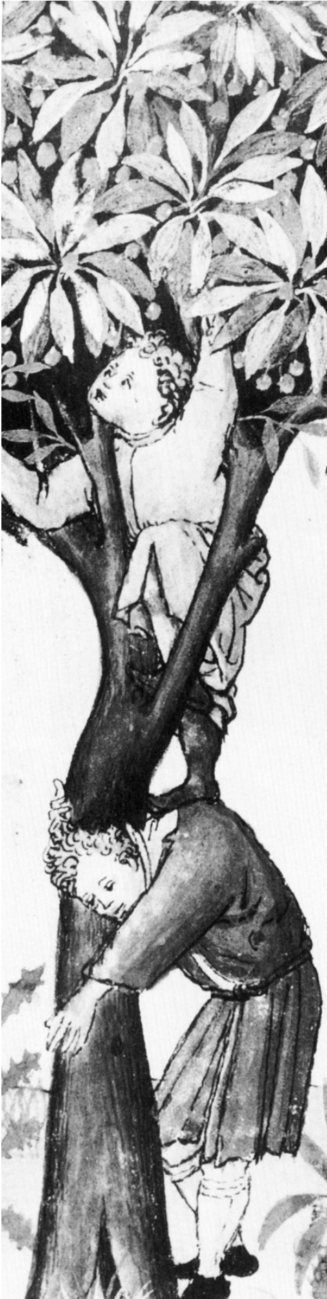
ילד מטפס על עץ דובדבן. פרט מתוך כתביד מאויר (Tacinum Sanitatis), גרמניה, המחצית השנייה של המאה ה-15.

את תרבות הפנאי של הצעירים, אך השפעתן על הצעירים היתה "שטחית וזמנית", ולפיכך לא אפשרה את התפתחותה של תודעה דורית נפרדת. השטחיות של השפעת קבוצת הגיל בלטה על רקע ההשפעה וכוח השליטה המוחלט שהיו, על-פי אייזנשטט, למשפחה, שהבטיחה יחסים הרמוניים והתגברות על מתחים פוטנציאליים בין הדורות. כך, למשל, בחברה הכפרית באירלנד במאה ה-19, "הפעילות של הצעירים מאחדת אותם [...] אך זו של המבוגרים עושה יותר: היא מאחדת צעירים ומבוגרים כאחד."