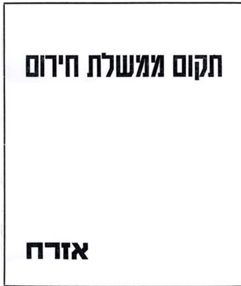
השם והכתיבת שמורים במערכת הארץ, 26.5.1967, עמוד ראשון

מאמר המערכת ב-25 במאי סימן תפנית בגישתו של הארץ כלפי עניין פוליטי מסעיר העומד על סדר היום, הרי כעבור יום התברר שהתביעה להחלפת צמרת קבלת ההחלטות במדינת ישראל זוכה לעוד ועוד ביטויים בהארץ.