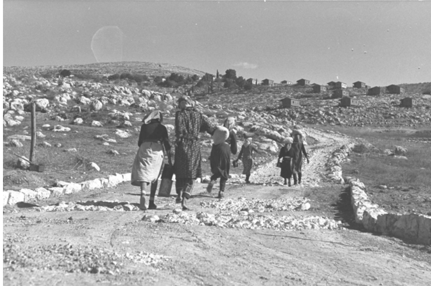
בדרך למושב אשתאול בהרי ירושלים, 1.8.1951

הקהילות הוצאו קבוצות קבוצות, ורובם התפזרו במהלך הסעתם ארצה במחנות מעבר שהוקמו בצרפת, באיטליה, בעדן ועוד. 12 פיזור העולים נמשך גם לאחר העלייה כשהם