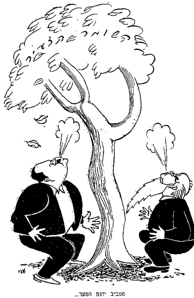
השבוע בקיבוץ הארצי, 20.3.1953

לפרדציה שהקימה את מפ"ם הצטרף משה סנה. סנה אמנם הגיע לברו, ללא תנועה תומכת, אולם, האיש שהביא עמו נכסים אישיים מרשימים, שהיה מנהיג התנועה הציונית בפולין, ראש המטה הארצי של ההגנה וחבר הנהלת הסוכנות היהודית – קיבע לעצמו מעמד בולט במפלגה. למרות שסנה לא היה חניך תנועת הנוער, המסורות שלה היו זרים לו, כך גם הקוד הפנימי של יחסי מדריך-חניך ומשמעות ההנהגה ההיסטורית, עלה בידיו לשבות את לב הרדיקאלים שבין חניכי התנועה. הוא לא נרתע מהתמודדות פוליטית ישירה מול חבריו לצמרת מפ"ם כאשר היעד החשוב אותו ביקש לכבוש היו אותם צעירים שלבם הלך שבי אחר חלום 'עולם המחר'. סנה זיהה את הפער שהתהווה בין חזן לבין חניכיו. הוא הפנה את תשומת הלב של החניכים לכך שחזן ביקש מאוד להצטרף לקואליציה הרפורמיסטית של ממשלת בן-גוריון, חסידם של מחרחרי המלחמה האמריקאים, בעוד הוא עצמו תובע להפוך את מפ"ם לאלטרנטיבה לשלטון מפא"י. משוחרר מעכבות הציע סנה 'פרימאט' אחר. במקום הניסוחים הנפתלים של תורת השלבים, המבקשת למצוא שילוב בין הציונות לסוציאליזם, בין המרכסיזם לקיבוץ הוא הציע 'חד-נס אדום'.